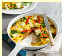
■ ФРИТТАТА С КУРИЦЕЙ И СЫРОМ ФЕТА