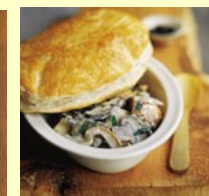
■ РАГУ С КУРИЦЕЙ И ГРИБАМИ