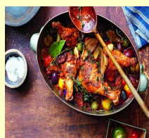
■ КУРОЧКА, ТУШЕНАЯ С ВИНОМ И ОВОЩАМИ