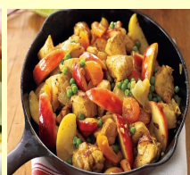
■ КУРИНОЕ КАРРИ С ЯБЛОКАМИ