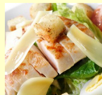
■ ЦЕЗАРЬ С КУРИЦЕЙ