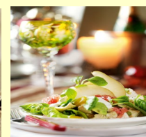
■ САЛАТ С КУРИЦЕЙ, ГРУШЕЙ, АВОКАДО И ГРЕЙПФРУТОМ