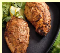
• КУРИНЫЕ ГРУДКИ ПО-ИТАЛЬЯНСКИ