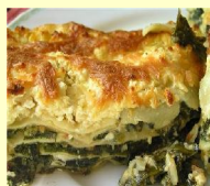
• ПИРОГ С КУРИЦЕЙ, ТВОРОГОМ И ШПИНАТОМ