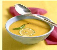
• КУРИНЫЙ СУП С СЫРОМ