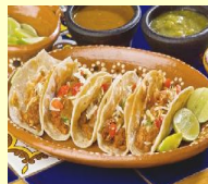
• КУРИНЫЕ ТАКОС