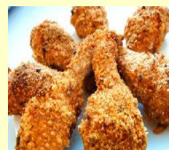
• КУРИНЫЕ НОЖКИ С ПАРМЕЗАНОМ И ЛИМОНОМ