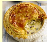
• ПЕСОЧНЫЙ ПИРОГ С КУРИЦЕЙ, КАБАЧКАМИ И БРЫНЗОЙ